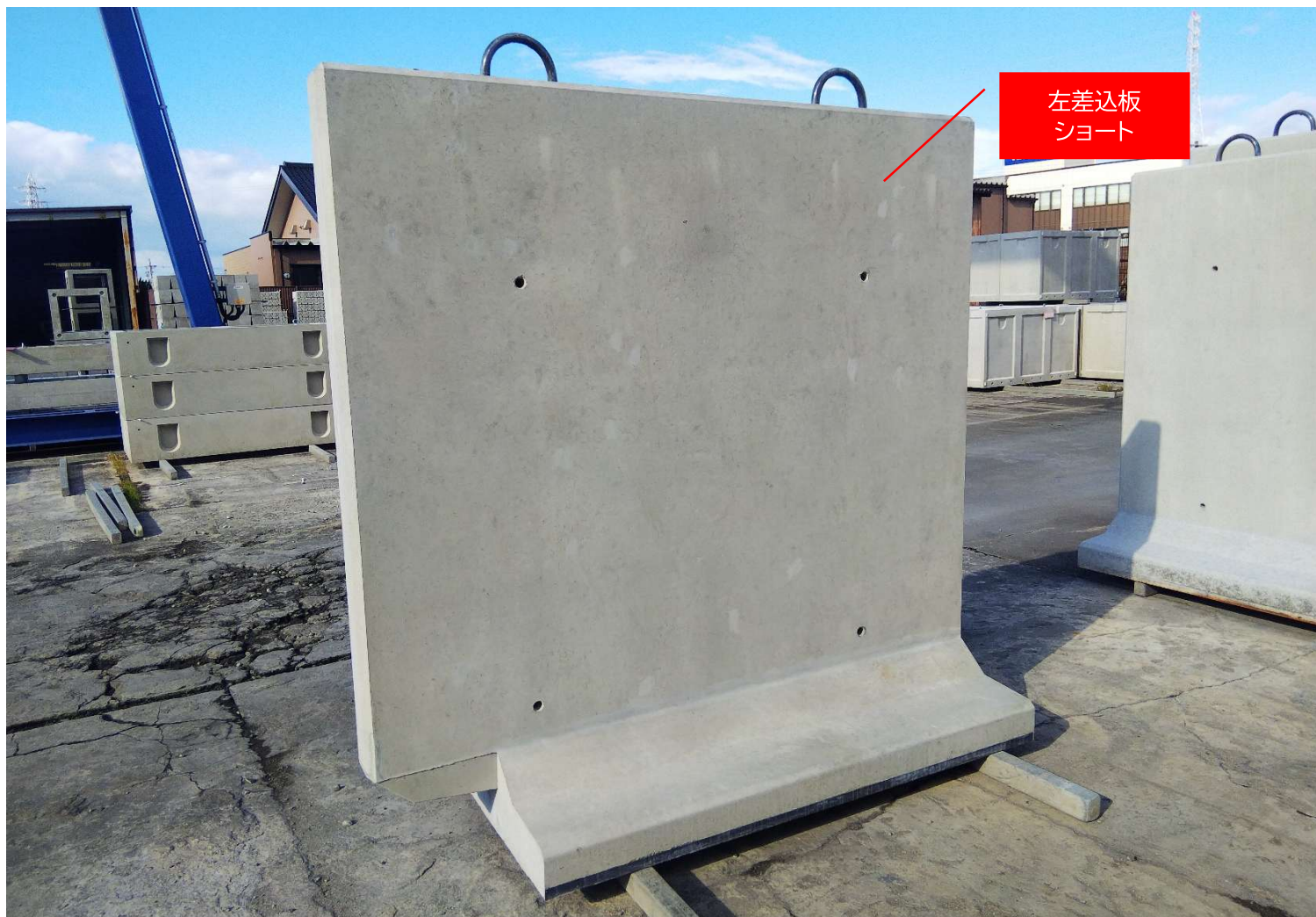
差込（左右）ショートと標準板、左右差込板のレイアウト例